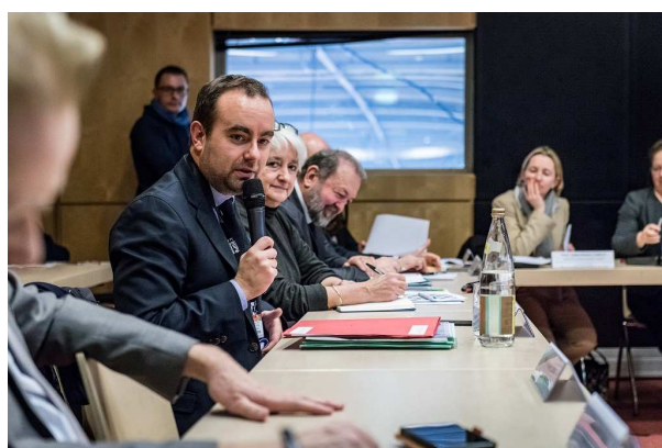
Visite de Sébastien Lecornu au 55 e Salon International de l'Agriculture – Février 2018.

« La méthanisation est une filière prometteuse qui crée de l'emploi, permet de verdir une partie du gaz que nous consommons et qui stabilise le revenu agricole. Comme lors du groupe de travail éolien, l'objectif est de définir un plan d'action opérationnel permettant de trouver des solutions à des problèmes anciens. Il doit permettre l'accélération de l'installation d'unités de méthanisation qui contribueront à l'atteinte de nos objectifs de décarbonation de la production d'électricité » a déclaré le secrétaire d'État auprès du ministre d'État, ministre de la Transition écologique et solidaire.